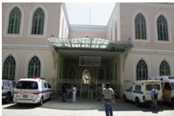
El Hospital Vargas de Caracas en la actualidad.