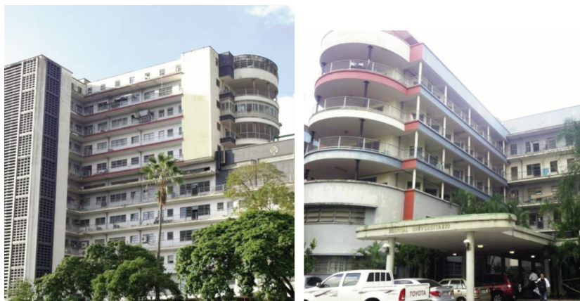
Dos tomas fotográficas del Hospital Universitario de Caracas en la actualidad.