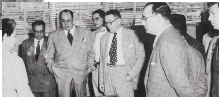
Centro Médico de Caracas, en San Bernardino, en la fecha de su inauguración, 1956.