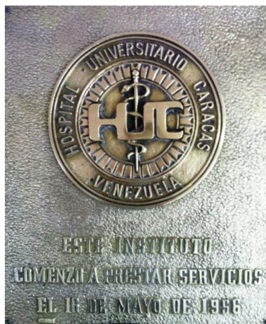
Fecha de inauguración del Hospital Universitario de Caracas el 16 de Mayo de 1956.

En asamblea ordinaria del 19 de octubre de 1948 reunida