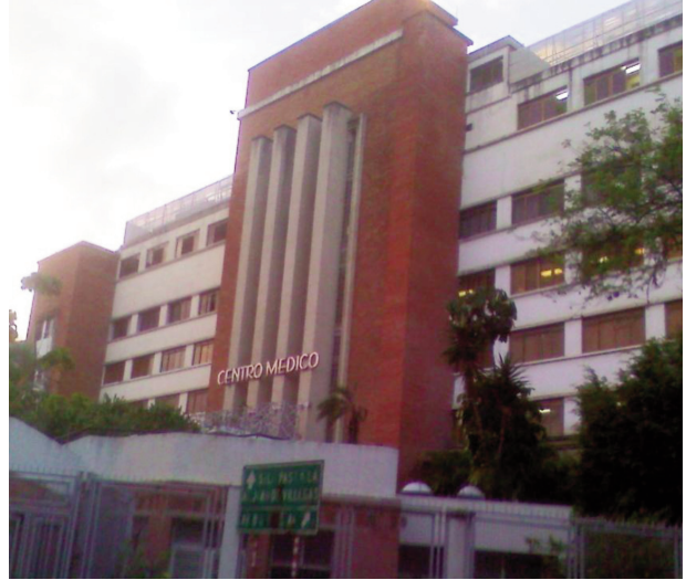
Centro Médico de Caracas en la actualidad..