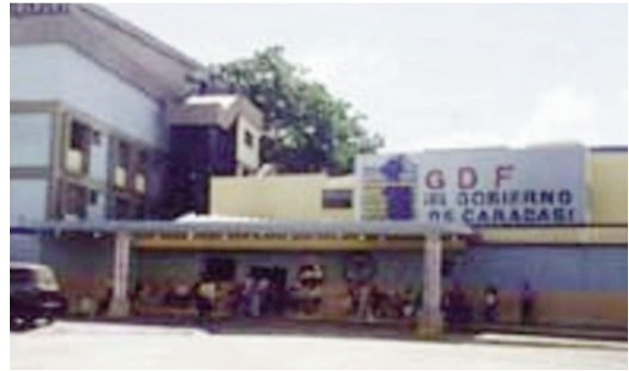
Hospital: Ricardo Baquero González.