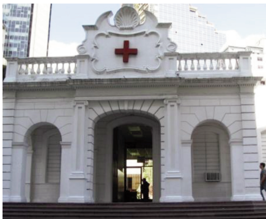
La Cruz Roja de Caracas o también llamado Hospital “Carlos J Bello” en la actualidad.