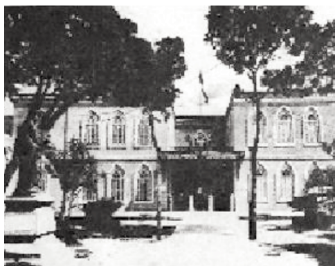
Hospital Vargas de Caracas.