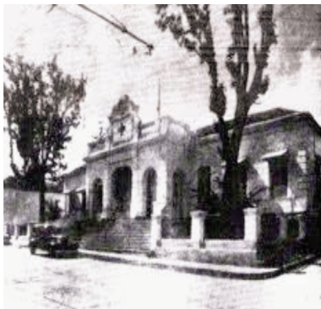
La Cruz Roja de Caracas.