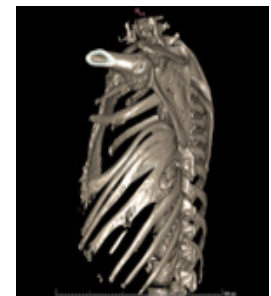
Figura 4. Fusión y deformidad del 3er al 6to arco costal posterior