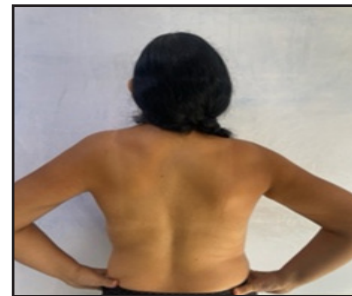
Figura 2. Asimetría de hombro y signo de Sprengel izquierdos

evidenciándose (hipoplasia del pectoral mayor, dorsal ancho e infraespinoso; (Figura 3), deformidad y fusión del 3 er al 6 to arco costal posterior), (Figura 4) escoliosis y fusión de cuerpos vertebrales de T2-T6 (Figura 5). El ecocardiograma no arrojó anomalías cardíacas y con la ecografía abdominal se descartó alguna alteración renal.