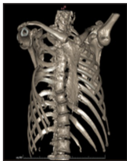
Figura 5. Escoliosis y fusión de T2-T6

Se establece así, de manera incidental, el diagnóstico de Síndrome de Poland, estadio II (según la clasificación de Foucras) 5 en esta paciente que, hasta dicho momento, lo desconocía a pesar de haber tenido entrada al sistema de salud, desde su nacimiento hasta la actualidad.